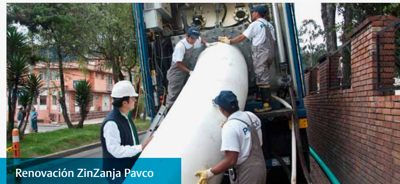
Renovación ZinZanja Pavco

El sistema Aquacell, tecnología europea, recientemente fabricado en Colombia, acumula el agua en el área donde se precipita, para luego ser absorbida dentro de la estructura formada por las celdas (AguaCell), se infiltra en el suelo o puede ser retenida por un tiempo antes de ser descargada al alcantarillado o conservada para ser reusado en riego y limpieza o con algún tratamiento posterior, como agua potable.