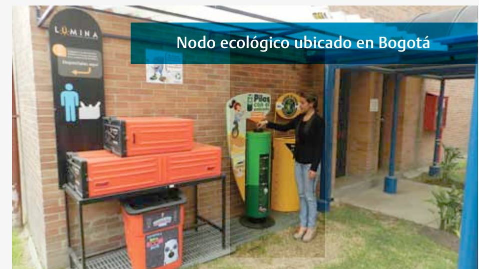
Nodo ecológico ubicado en Bogotá

Pavco se sumó al programa ECOPUNTO, liderado por la Asociación Nacional de Empresarios de Colombia ANDI. Dicho programa fue diseñado para gestionar los productos que revisten un mayor riesgo ecológico (recolección y disposición) y que al final de su vida útil desechan los consumidores. Pavco presentó el proyecto a los colaboradores bajo el nombre “Y tu a que te comprometes”, e invitó desde sus hogares a recolectar los desechos de las pilas, luminarias y envases de insecticidas.