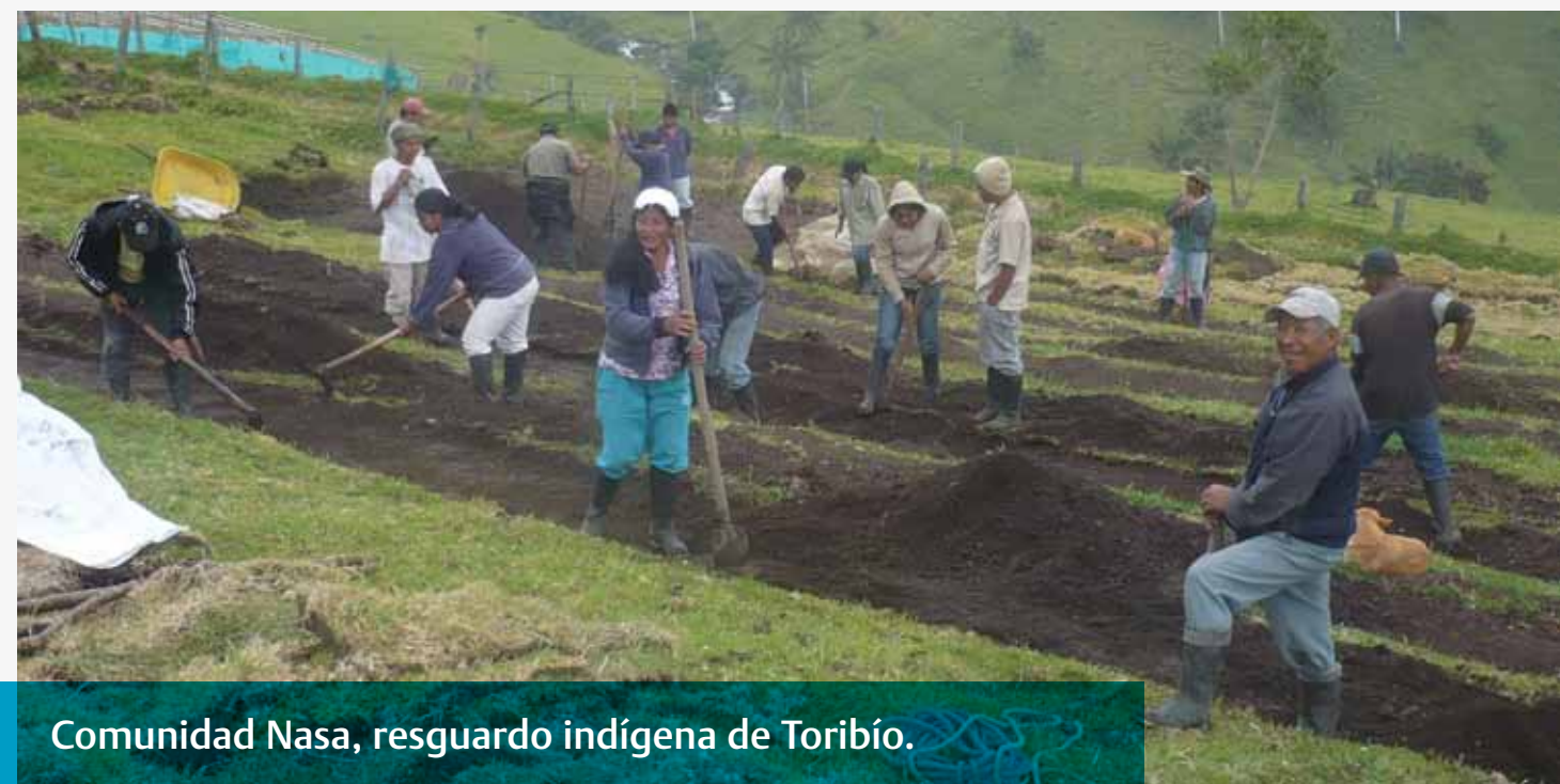
Comunidad Nasa, resguardo indígena de Toribío.

El objetivo de este proyecto fue contribuir a proteger y conservar ecosistemas estratégicos en las fuentes de agua, páramos, sub páramos y bosques altos andinos, garantizando los servicios hídricos a largo plazo para todos los usuarios del área de influencia de la cuenca hidrográfica del Río Palo. La inversión de Pavco fue de $100 millones de pesos.